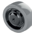
Abriebfeste ESD Hartkunststoffrolle