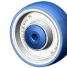
Polyurethan-Rolle oder Polyurethan-ESD-Rolle